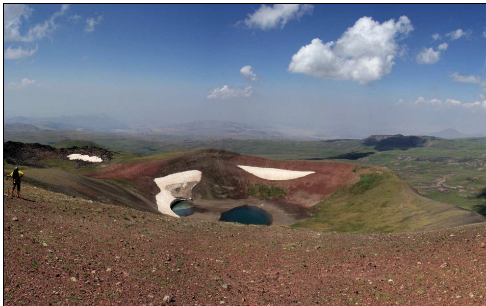
vetta del Tar (3530 m)

Per il ritorno procediamo in linea retta verso l'accampamento passando su un lungo nevaio, al termine del quale scopriamo la sorgente dell'acqua nelle nostre borracce.