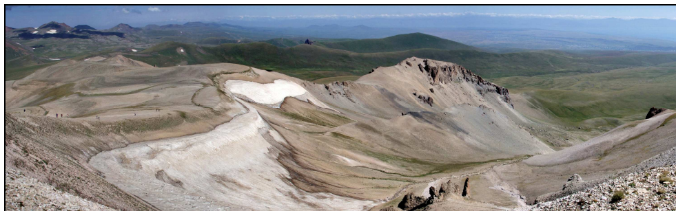
vetta dello Spitakasar, panorama verso est

La discesa è su un ripido ghiaione lungo 400m e ci riporta sui pascoli giusto in tempo per scappare dal maltempo in arrivo dal lago Sevan. Il temporale si ferma sullo Spitakasar, ma non riusciamo a sfuggire ad una leggera grandine che ci accompagnerà quasi fino all'accampamento successivo a 2800 metri, nei pressi delle sorgenti del monte Vishapasar.